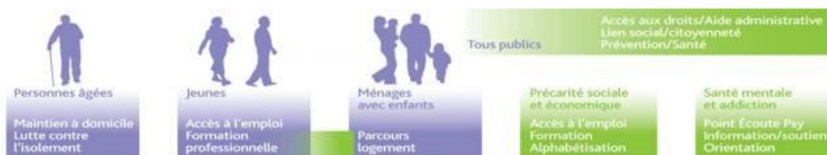
Programmes d'interventions « socles » d'Adoma en fonction des publics

Afin d'accompagner les publics dans leur parcours d'insertion, la résidence « L'Alternance » sera inscrite dans le programme d'intervention sociale, dont Adoma se dote pour chaque résidence et qui est réajusté chaque année. Ce programme s'articule autour de cinq axes : Santé ; Accès aux droits ; Logement ; Vie sociale, culture, loisirs et citoyenneté ; Insertion professionnelle.